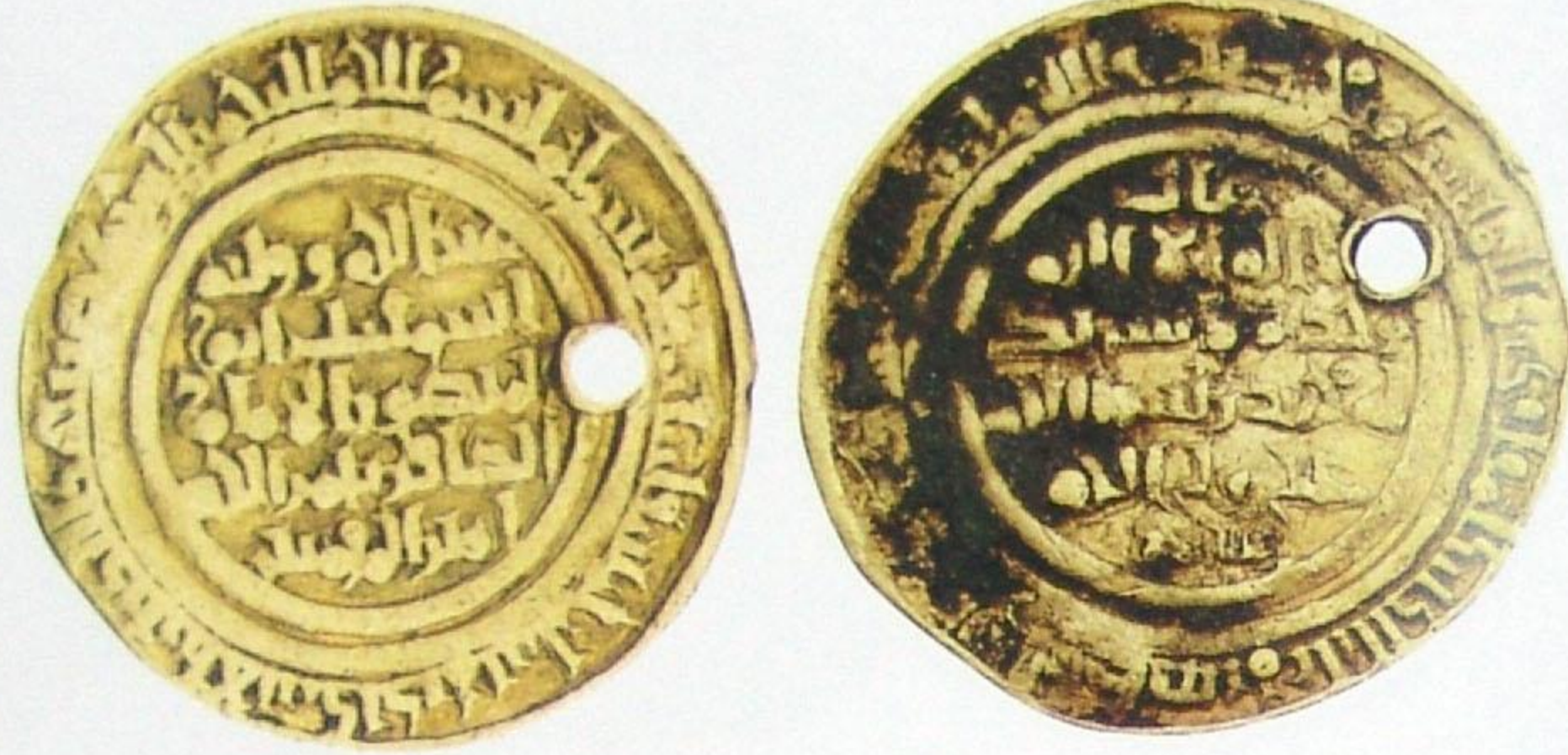
دينار فاطمي الطاهر بأمر الله ضرب: الإسكندرية سنة: ٥١٥ هجري